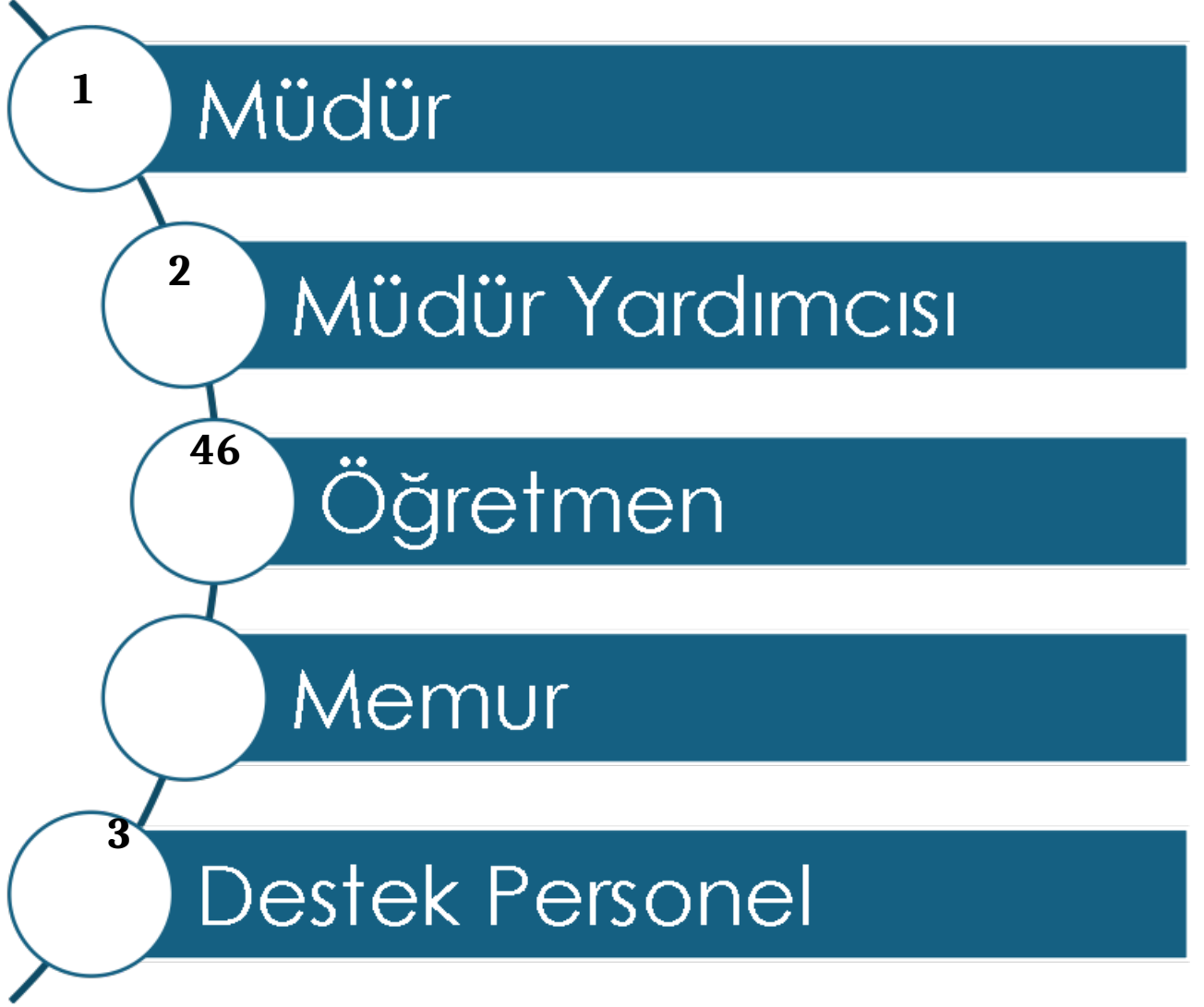
Şekil1: Teşkilat Şeması

Okulumuzun teşkilat yapısı aşağıdaki Şekil 1'de gösterilmiştir.